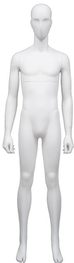
aum-101.BS-A T183.0/B86.0/W71.0/H89.0 ShoeSize26.0