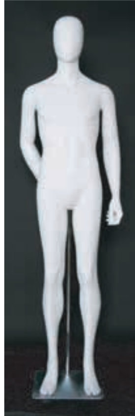
- MD - 6114 . B - C -