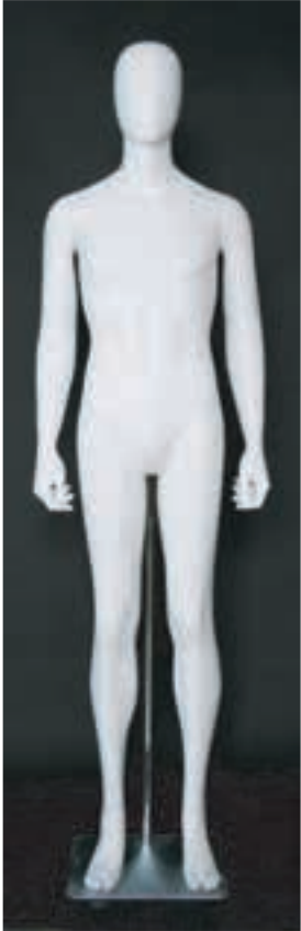
- MD - 6114 . B - A -