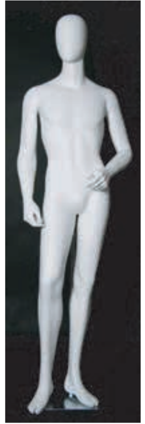
- MD - 6115 . B - F -