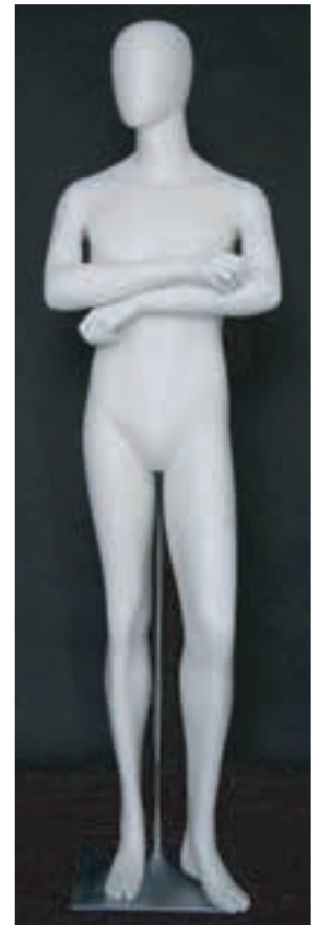
- MD - 6116 . B - E -