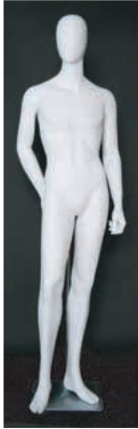
- MD - 6115 . B - C -