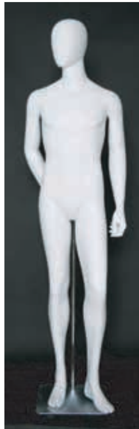
- MD - 6116 . B - C -