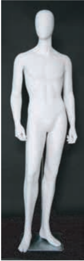
- MD - 6115 . B - A -