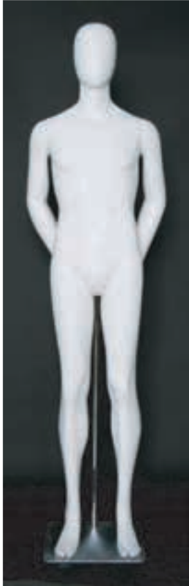
- MD - 6114 . B - B -