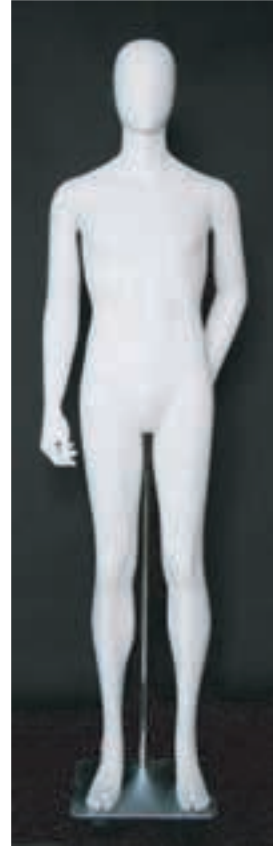
- MD - 6114 . B - D -