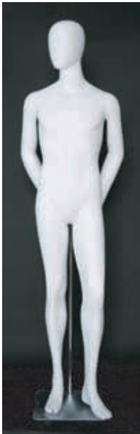
- MD - 6116 . B - B -