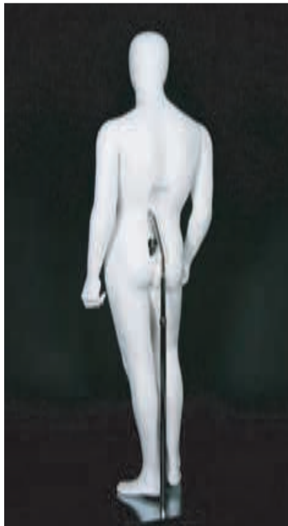
腰安定スタンドベース