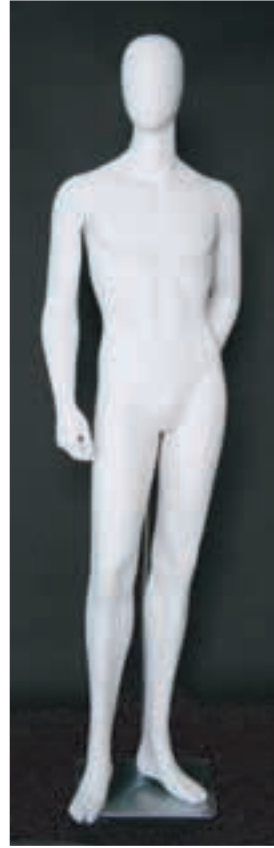
- MD - 6115 . B - D -