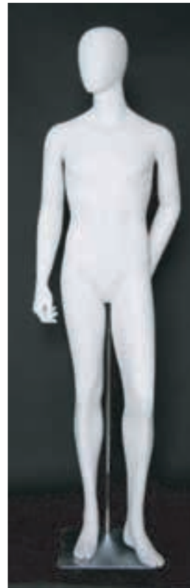
- MD - 6116 . B - D -