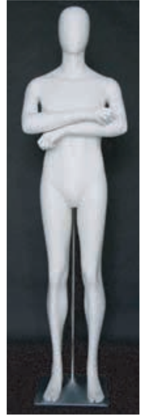
- MD - 6114 . B - E -