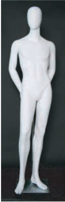
- MD - 6115 . B - B -