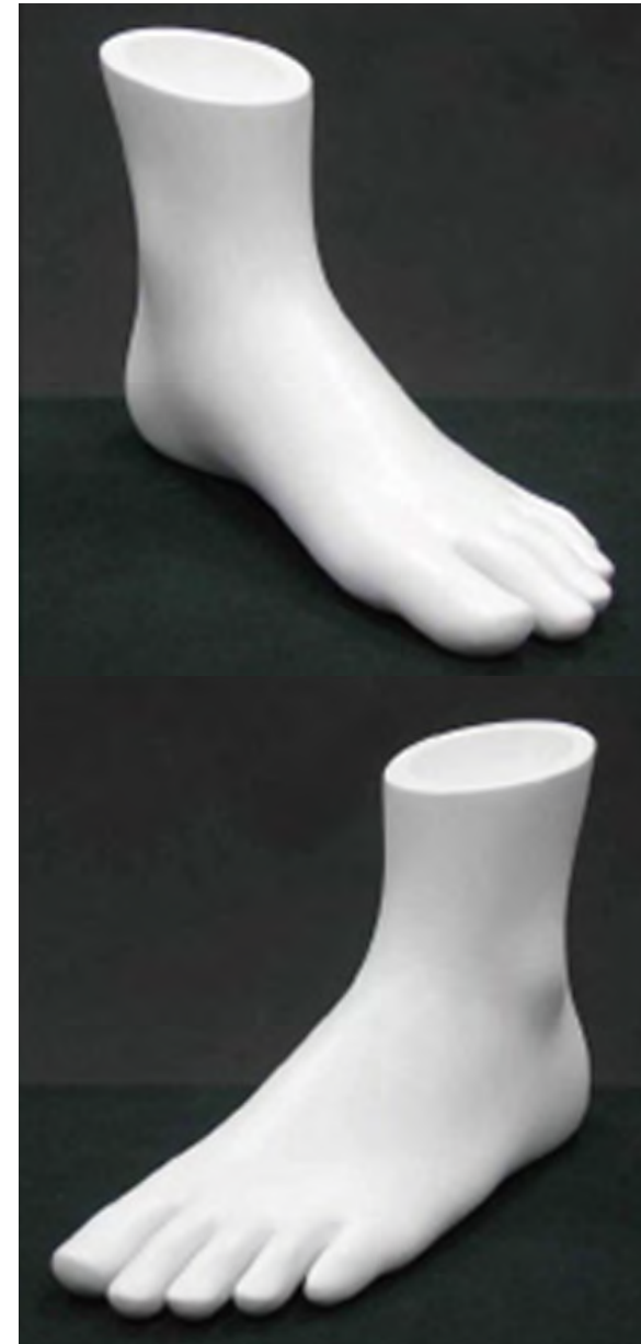
L-1H アンデル a