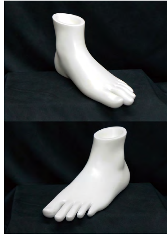
L-1H アングル a