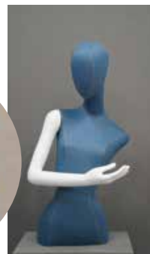
mim-02.B FRP-1 腕 10386 10388