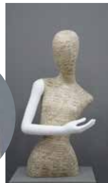
mim-02.A FRP-1 腕 10385 10388