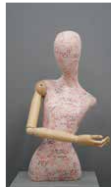
mim-02.C 木腕 10387 55014