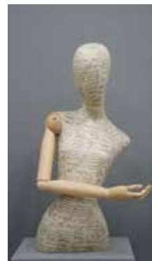
mim-02.A 木腕 10385 55014