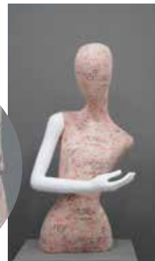
mim-02.C FRP-1 腕 10387 10388