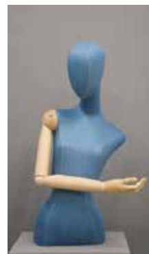
mim-02.B 木腕 10386 55014