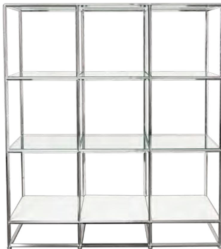
3列3段 脚付 / 91080