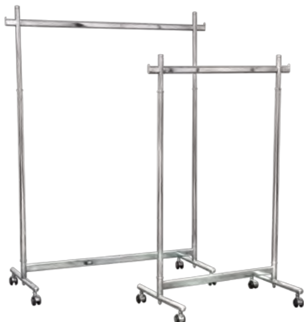
シングルハンガーラック クロームメッキ 90001