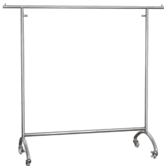
シングルハンガーラック クロームメッキヘアライン (M0-03-A) 90011