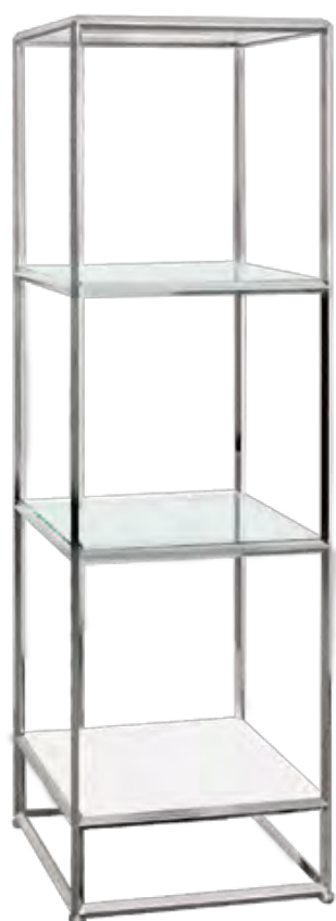
1列3段 脚付 / 91081

MATERIAL / 天板：透明ガラス 91083 フレーム：クロームメッキ ステージ：白化粧板 91082