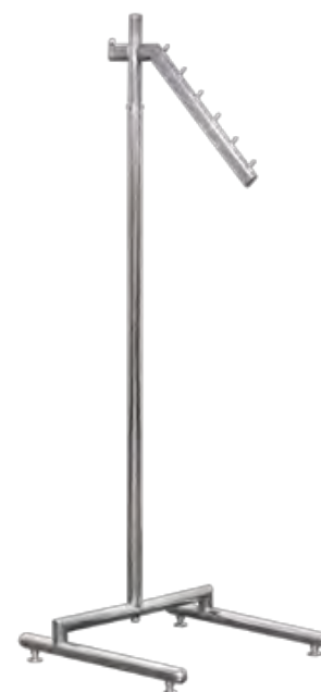
傾斜ハンガーラック クロームメッキ 90003