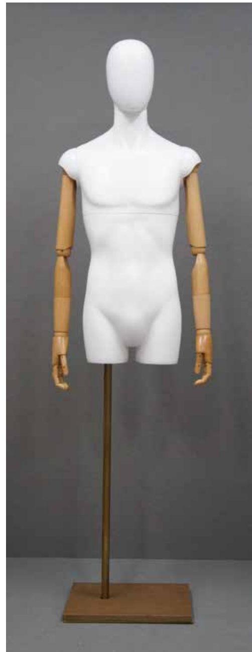
CFM-2101-F(木腕) B:95 W:76 H:94 cm