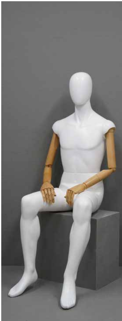
CFM-6201-F(木腕) B:95 W:74 cm