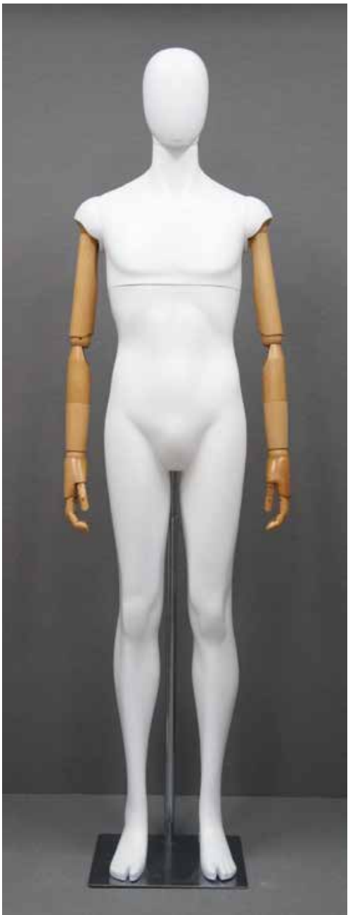
CFM-6101-F(木腕) T:186.5 B:95 W:76 H:94 cm