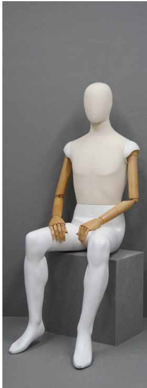
CFM-6201-W(木腕) B:95 W:74 cm