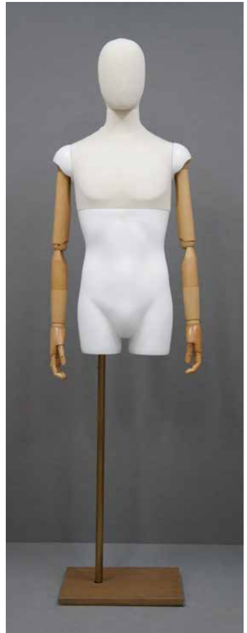
CFM-2101-W(木腕) B:95 W:76 H:94 cm