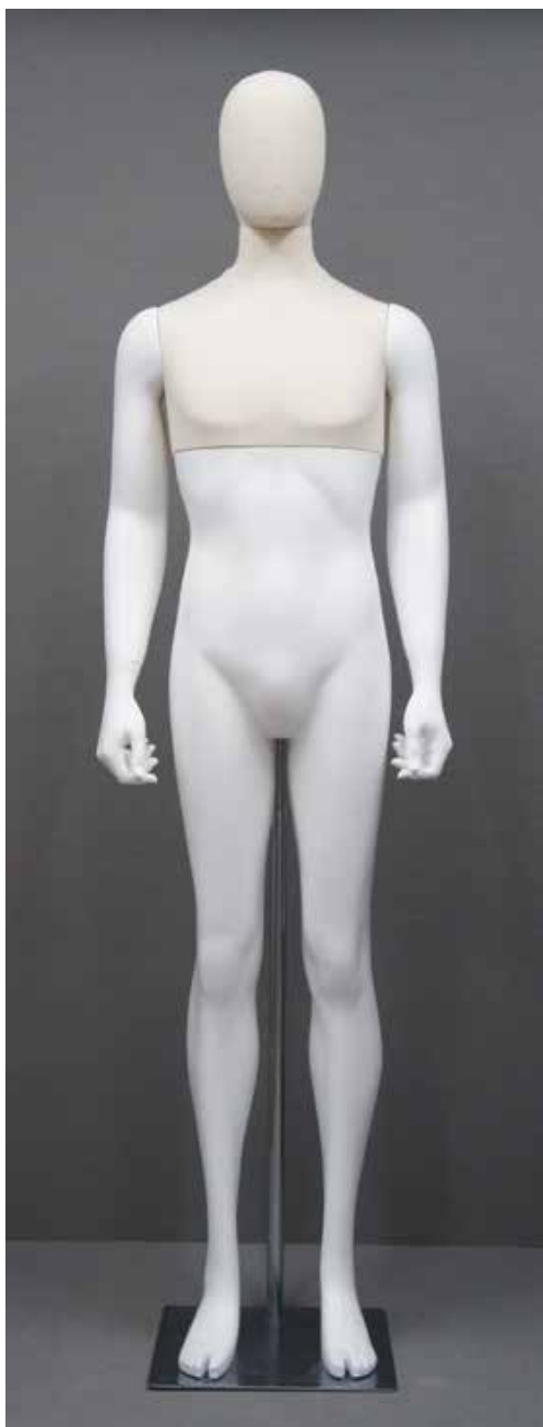
CFM-6101-W•FRP-1腕 T:186.5 B:95 W:76 H:94 cm