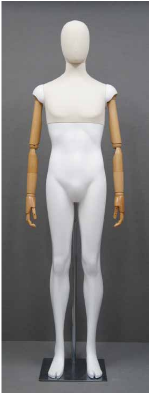
CFM-6101-W(木腕) T:186.5 B:95 W:76 H:94 cm