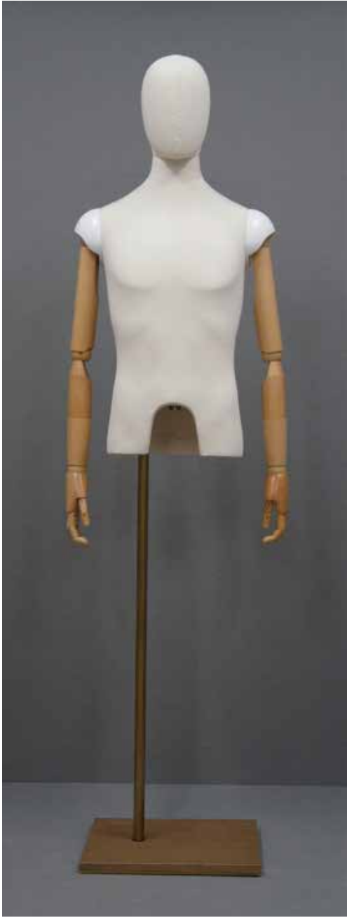
CFM-2201-W(木腕) B:95 W:76 cm