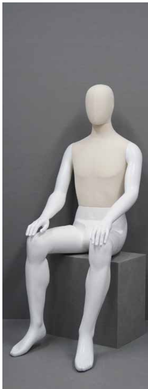
CFM-6201-W•FRP-1腕 B:95 W:74 cm