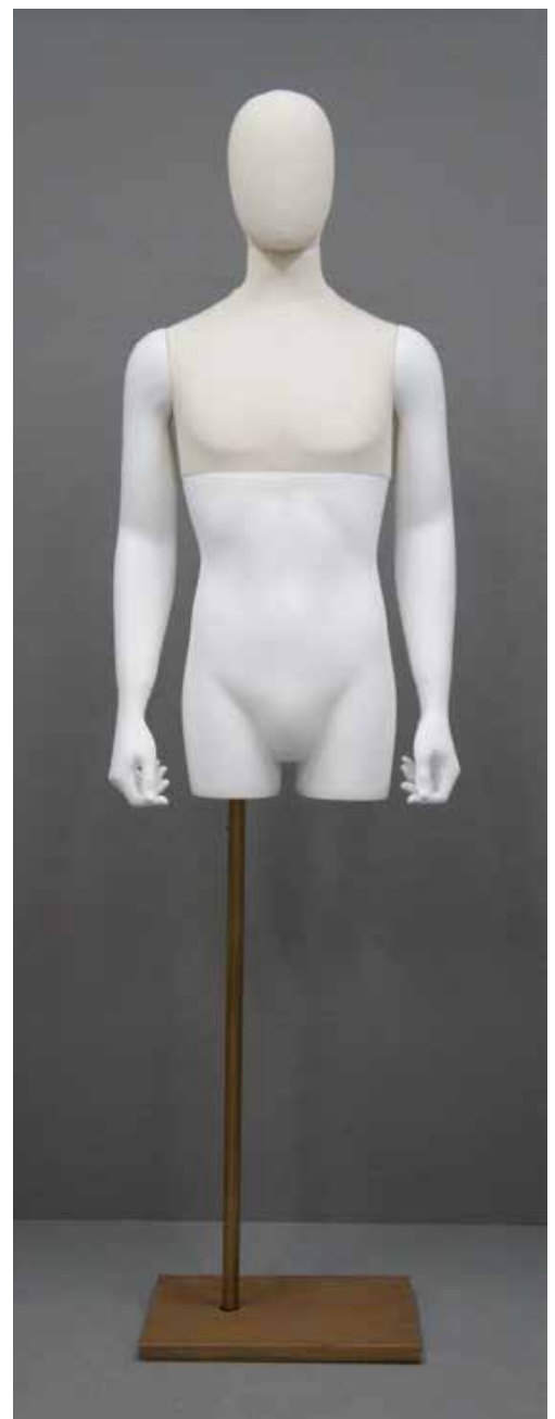
CFM-2101-W(FRP-1腕) B:95 W:76 H:94 cm