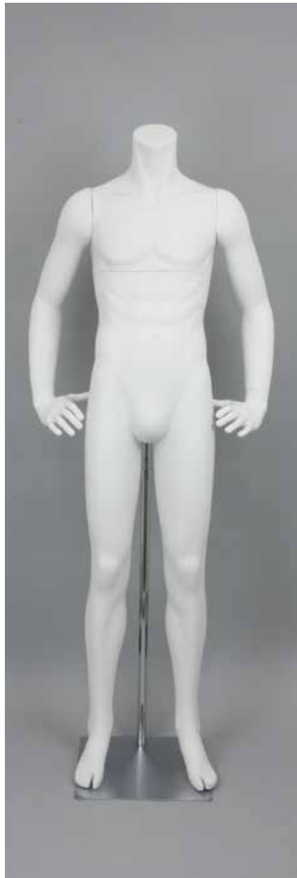
RD-101BS · DM-E T169.0/B91.0/W73.0/H91.0