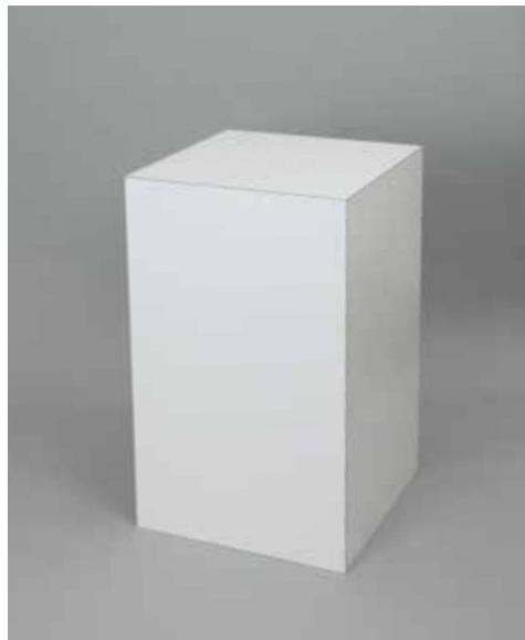
BOX H650 H65.0/W40.0/D40.0