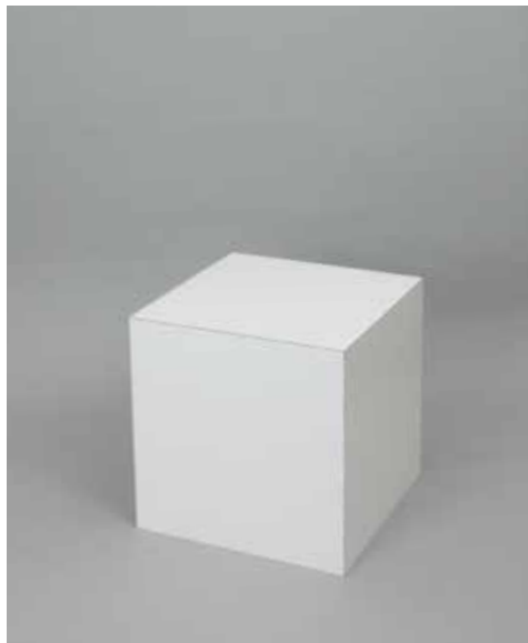
BOX H400 H40.0/W40.0/D40.0