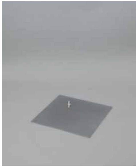
スチール HL ベース W40.0/D40.0