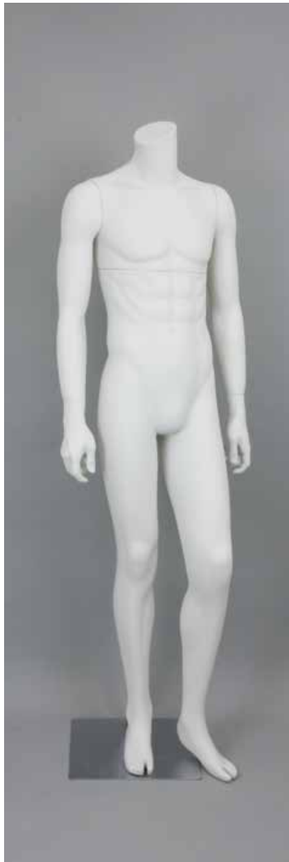
RD-102BS · DM-A T169.0/B91.0/W73.0/H91.0