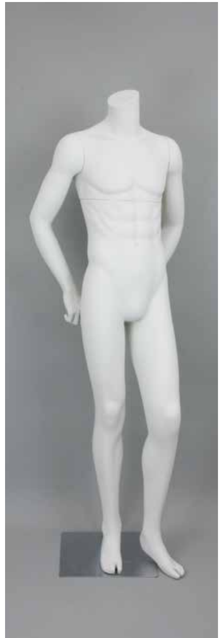
RD-102BS · DM-B T169.0/B91.0/W73.0/H91.0