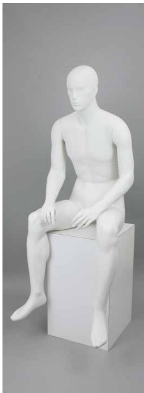
MD-6109A · N B95.0/W77.0