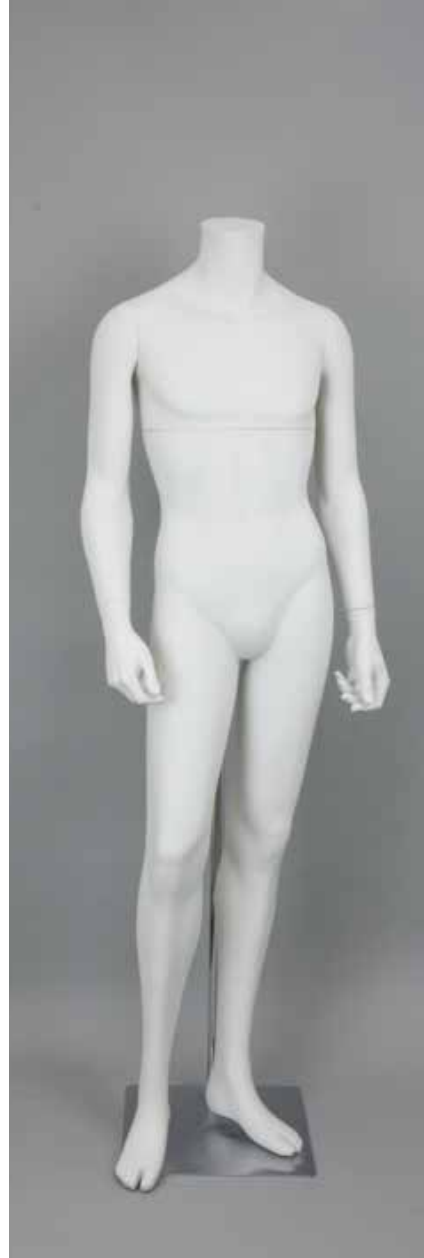
MD-6115DM · BS-A T168.0/B95.0/W75.0/H92.0