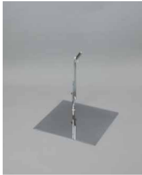
外部安定スタンド