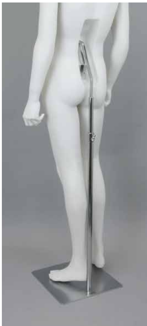
腰安定スタンドベース W35.0/D35.0