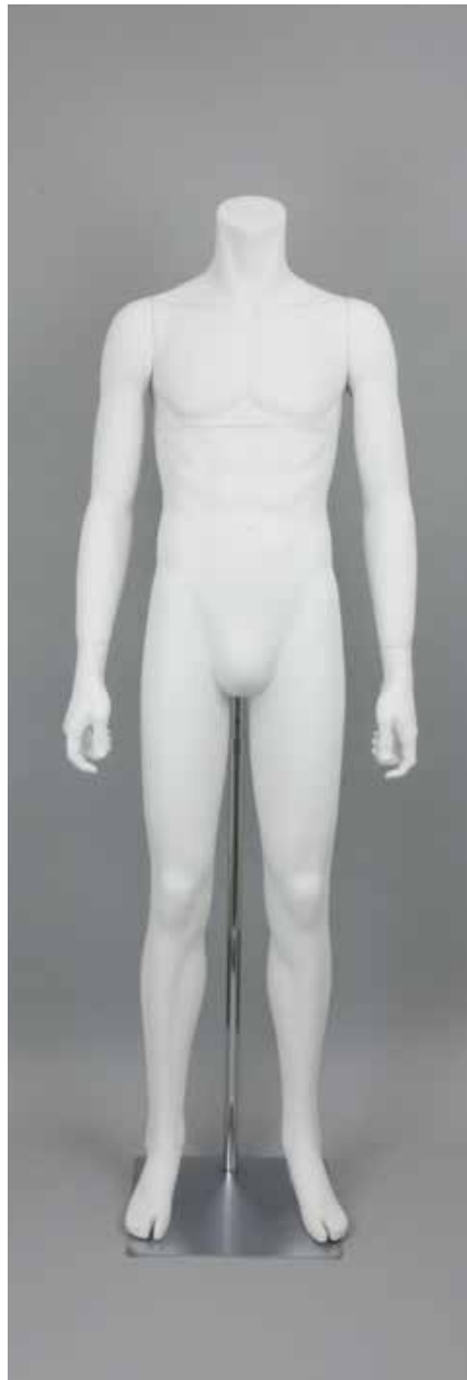
RD-101BS · DM-A T169.0/B91.0/W73.0/H91.0