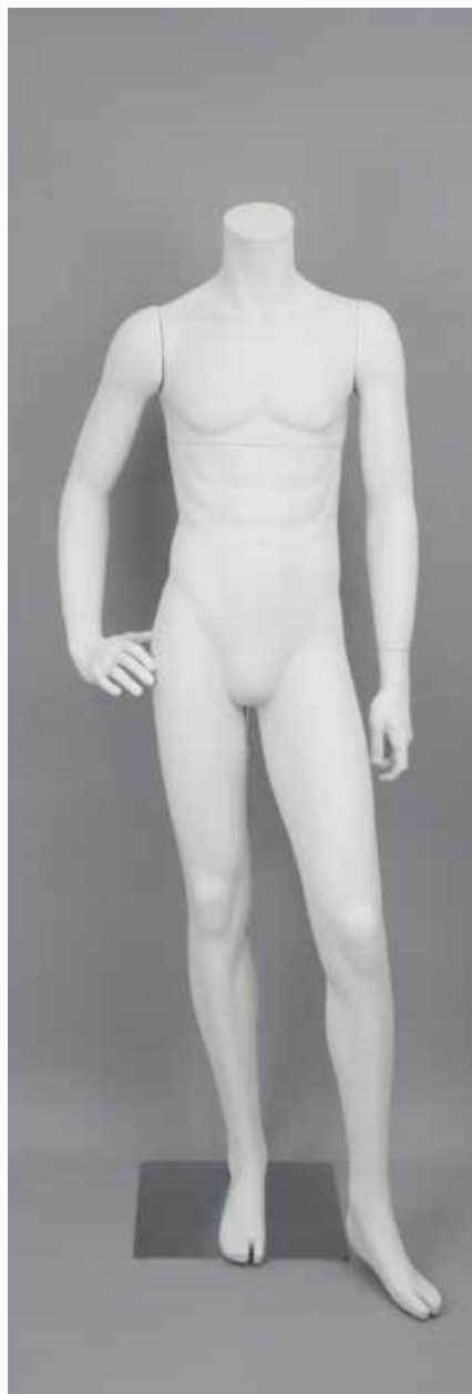
RD-103BS · DM-F T169.0/B91.0/W73.0/H91.0