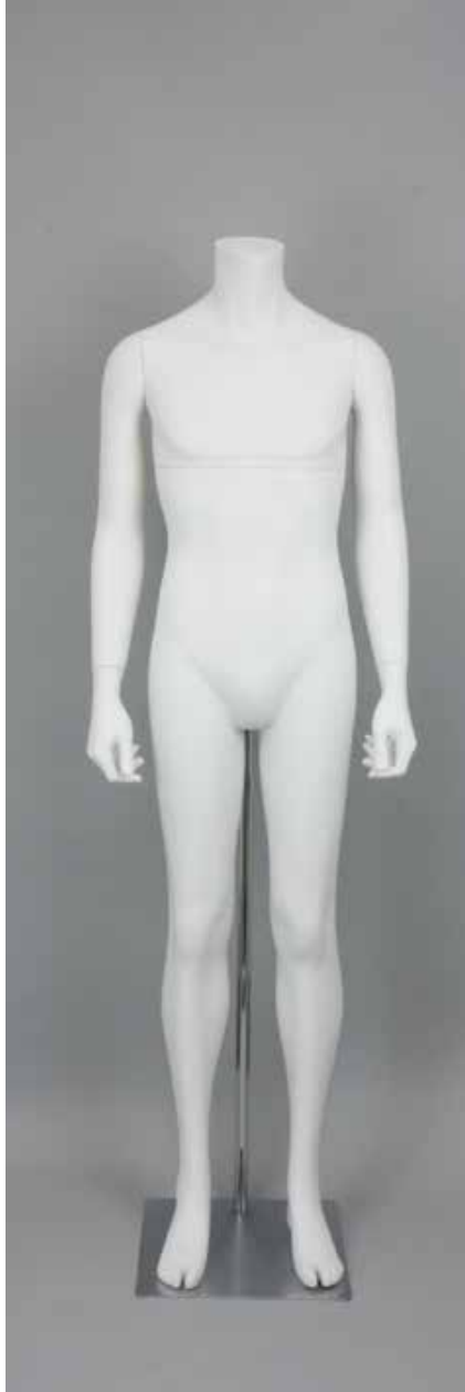
MD-6114DM · BS-A T168.0/B95.0/W76.0/H94.0