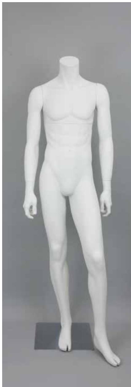
RD-103BS · DM-A T169.0/B91.0/W73.0/H91.0