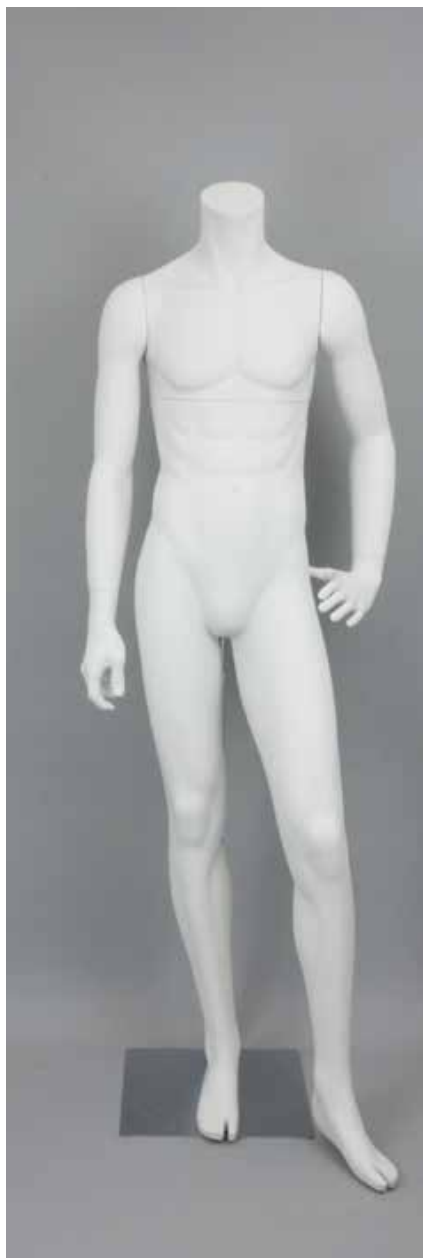
RD-103BS · DM-G T169.0/B91.0/W73.0/H91.0