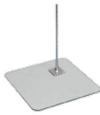
ガラスベース ストレート W40.0/D40.0