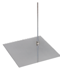
外部安定スタンド ストレート W40.0/D40.0