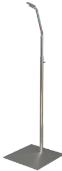
背中安定スタンド W35.0/D35.0 56007