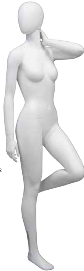
NSP-7816 T172.0/B81.0/W58.0/H87.0 wide50.0 FootSize22.0 DW:72823/A:72824/B:73057/R:72826/N:73103