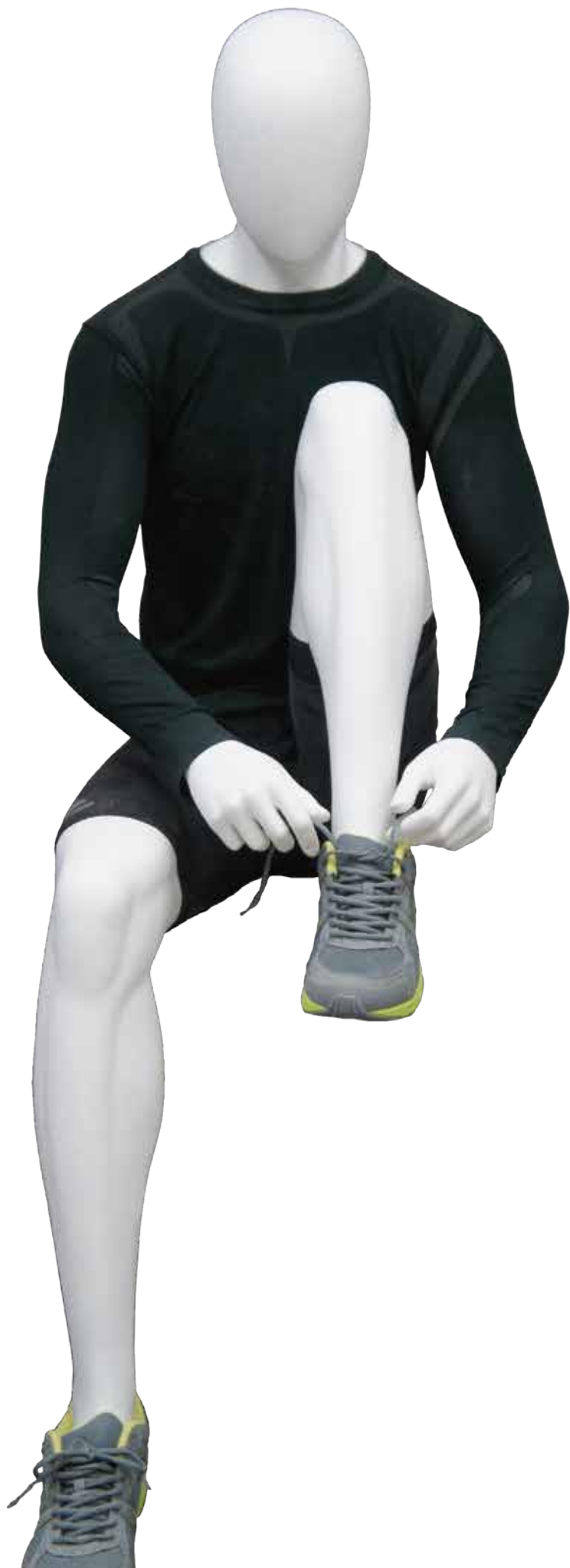
ガラスベース W40.0/D40.0 56003