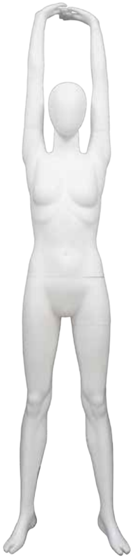
NSP-7804 T177.5/B84.0/W65.0/H91.0 FootSize23.0 DW:71254/A:71256/B:73048/R:71258/N:73098