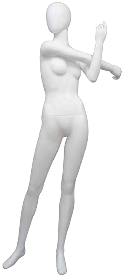
NSP-7815 T172.5/B78.0/W59.0/H87.0 wide75.0 FootSize22.0 DW:72818/A:72819/B:73056/R:72821/N:72812