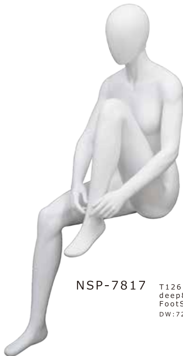
NSP-7817 T126.5/B79.5/W58.0/H- deep80.0/椅子高 43.0~ FootSize22.0 DW:72828/A:72829/B:73058/R:72831/N:73104