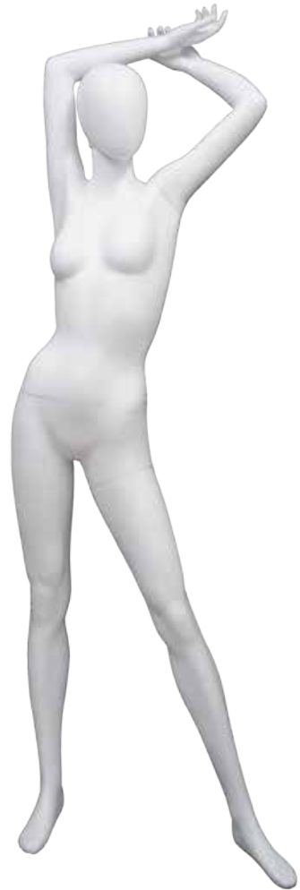
NSP-7814 T172.0/B81.0/W59.0/H88.0 wide65.0 FootSize22.0 DW:72813/A:72814/B:73055/R:72815/N:72811