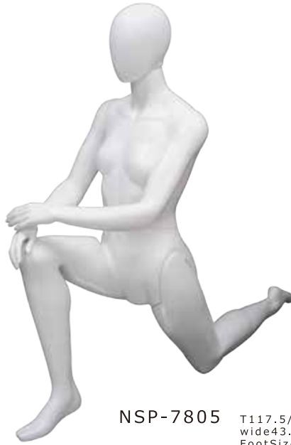
NSP-7805 T117.5/B84.0/W65.0 wide43.0/deep134.0 FootSize23.0 DW:71255/A:71257/B:73049/R:71259/N:73099