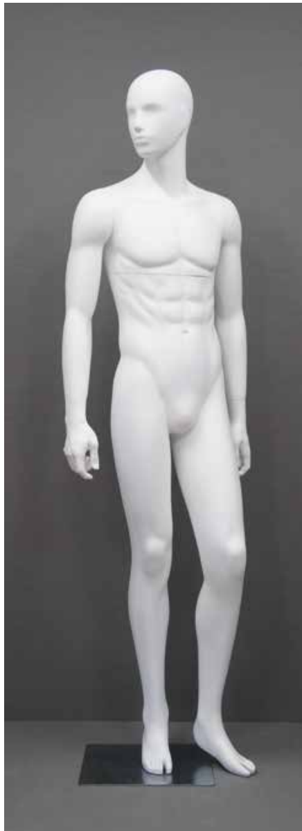
RD-102.BS.R-A T 185.0/B 91.0/W 73.0/H 91.0