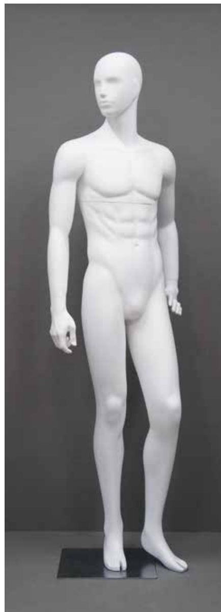
RD-102.BS.R-G T 185.0/B 91.0/W 73.0/H 91.0