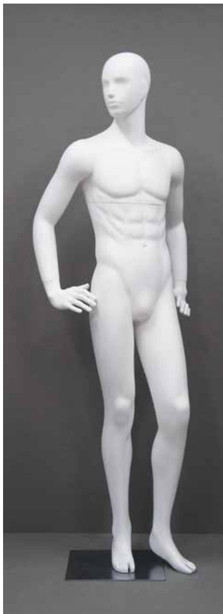
RD-102.BS.R-E T 185.0/B 91.0/W 73.0/H 91.0