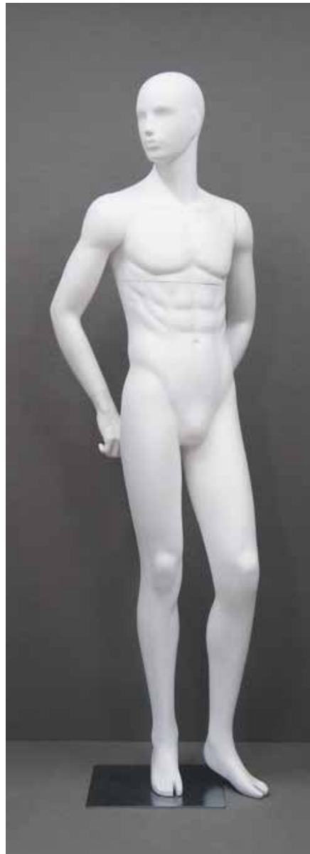
RD-102.BS.R-B T 185.0/B 91.0/W 73.0/H 91.0