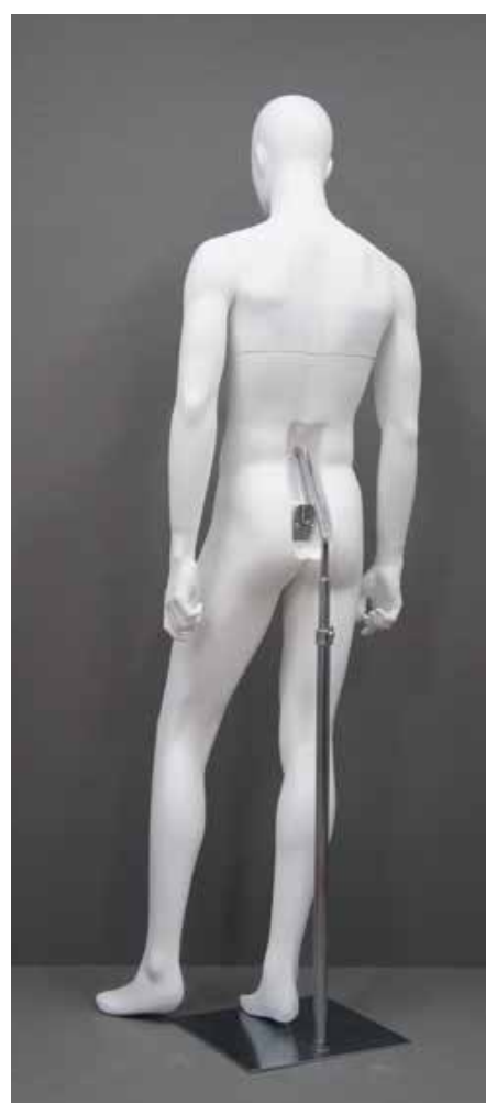
腰安定スタンドベース W 35.0/D 35.0