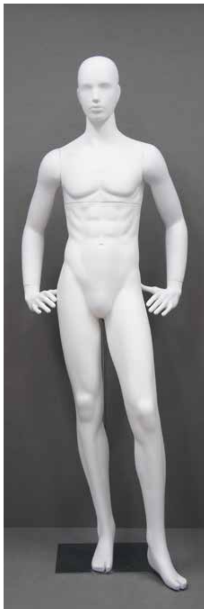
RD-103.BS.R-E T 185.0/B 91.0/W 73.0/H 91.0