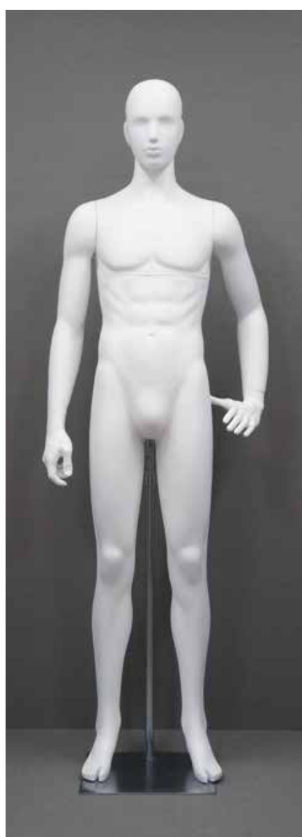
RD-101.BS.R-G T 185.0/B 91.0/W 73.0/H 91.0