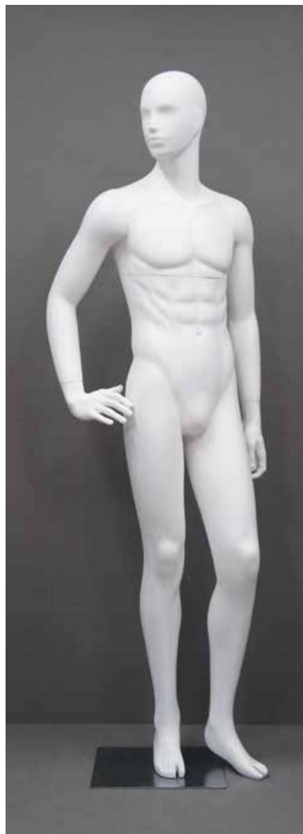
RD-102.BS.R-F T 185.0/B 91.0/W 73.0/H 91.0