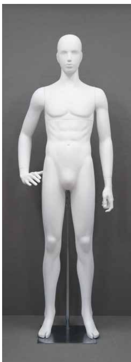
RD-101.BS.R-F T 185.0/B 91.0/W 73.0/H 91.0