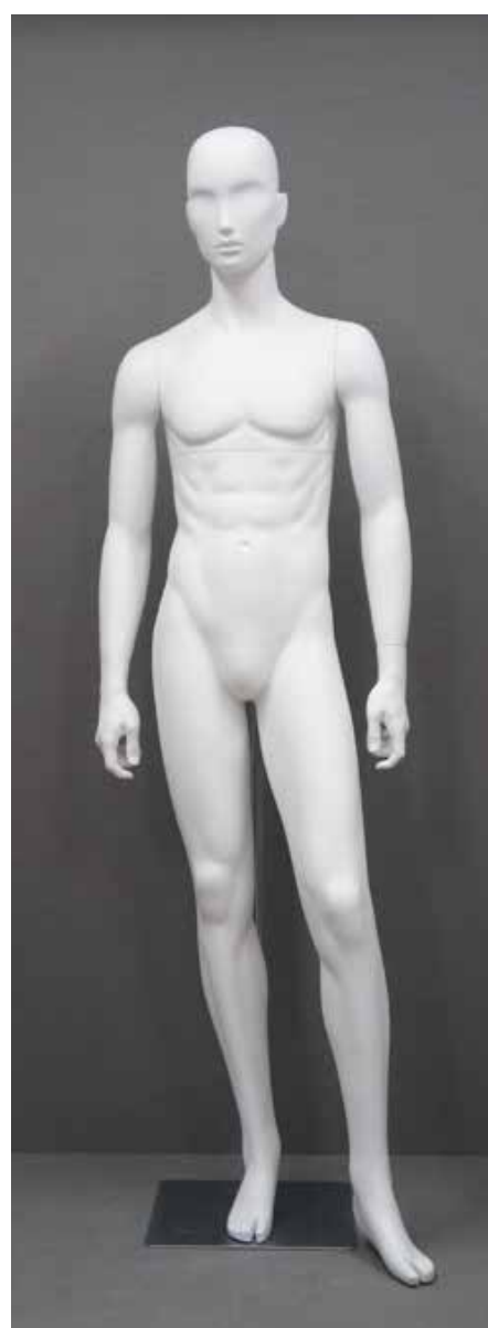
RD-103.BS.A-A T 185.0/B 91.0/W 73.0/H 91.0