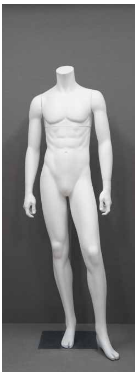
RD-103.BS.DM-A T 169.0/B 91.0/W 73.0/H 91.0