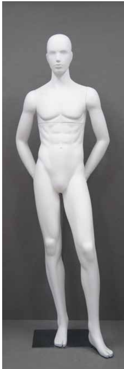
RD-103.BS.R-B T 185.0/B 91.0/W 73.0/H 91.0