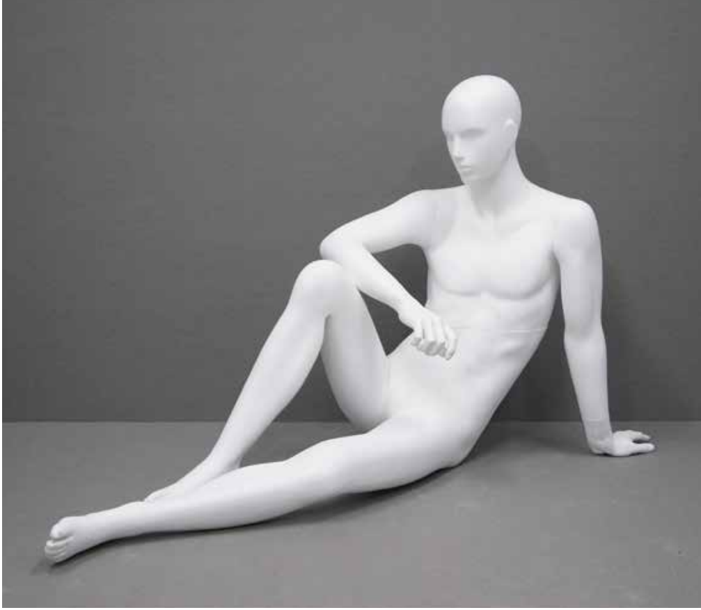
RD-104.R B 90.0/W 73.0