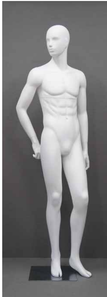
RD-102.BS.R-C T 185.0/B 91.0/W 73.0/H 91.0