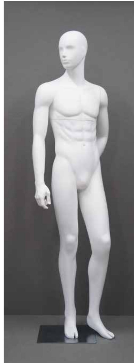
RD-102.BS.R-D T 185.0/B 91.0/W 73.0/H 91.0