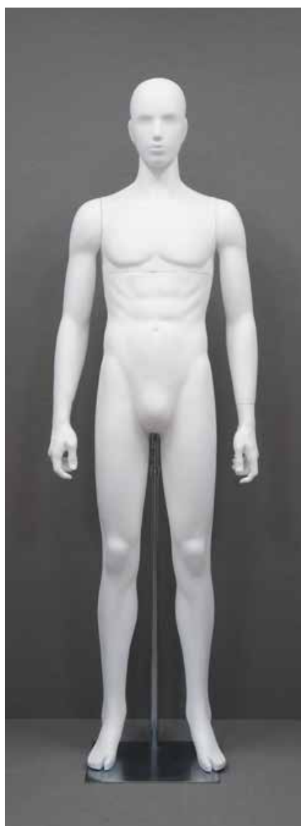
RD-101.BS.R-A T 185.0/B 91.0/W 73.0/H 91.0