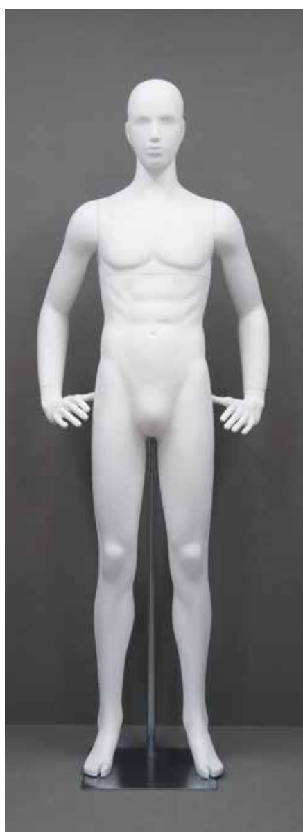
RD-101.BS.R-E T 185.0/B 91.0/W 73.0/H 91.0