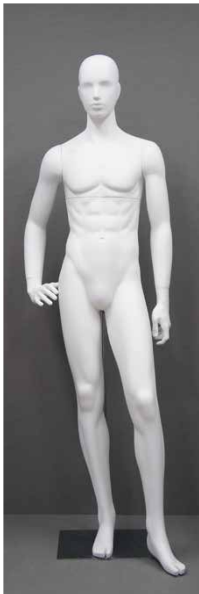
RD-103.BS.R-F T 185.0/B 91.0/W 73.0/H 91.0