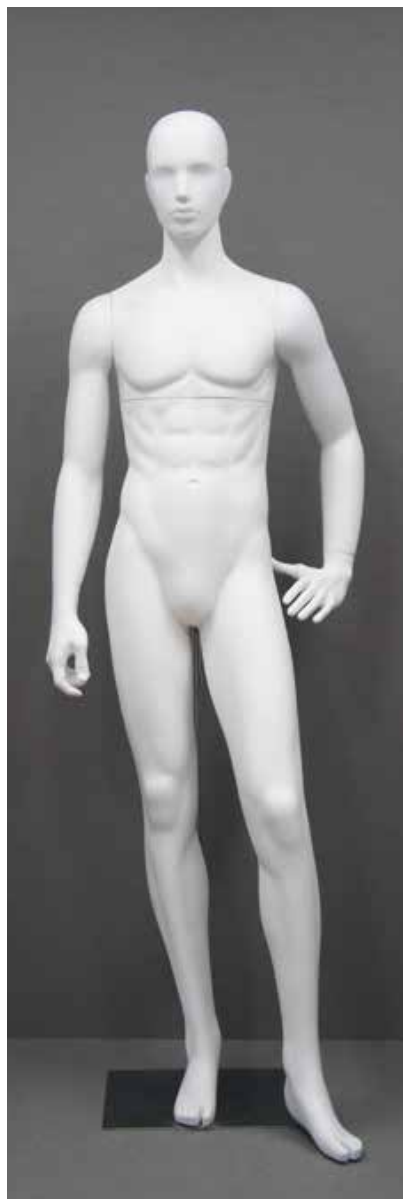
RD-103.BS.R-G T 185.0/B 91.0/W 73.0/H 91.0