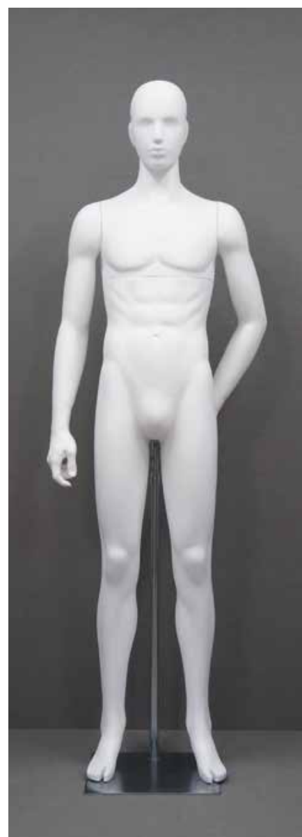
RD-101.BS.R-D T 185.0/B 91.0/W 73.0/H 91.0