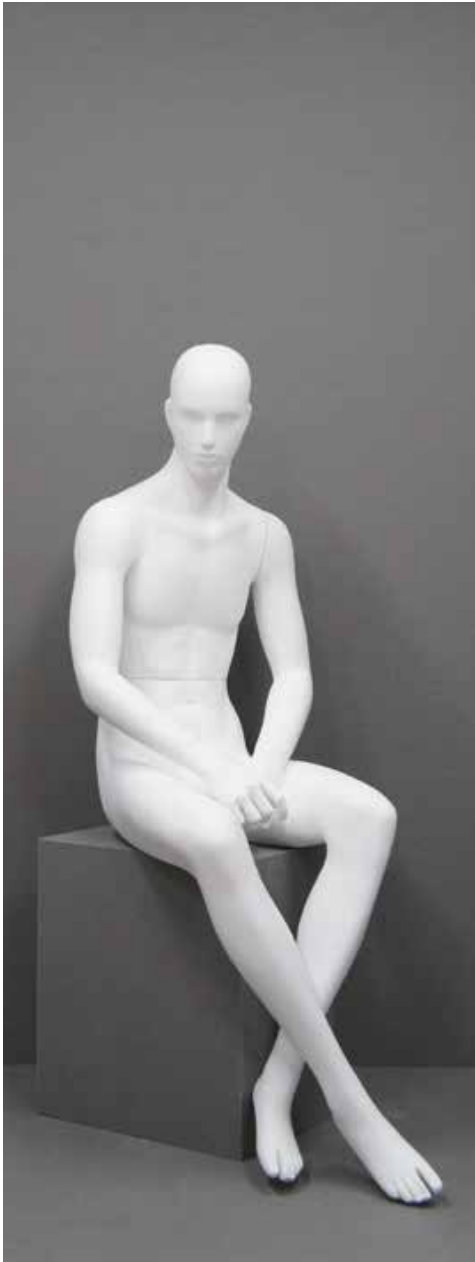
RD-105.R B 90.0/W 73.0