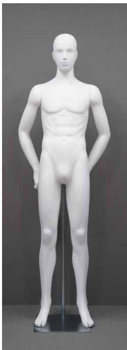
RD-101.BS.R-B T 185.0/B 91.0/W 73.0/H 91.0