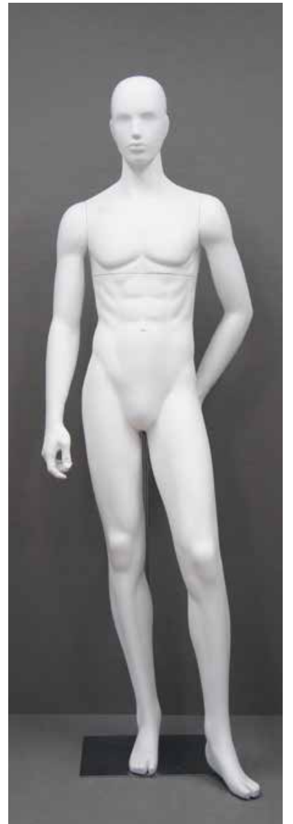
RD-103.BS.R-D T 185.0/B 91.0/W 73.0/H 91.0