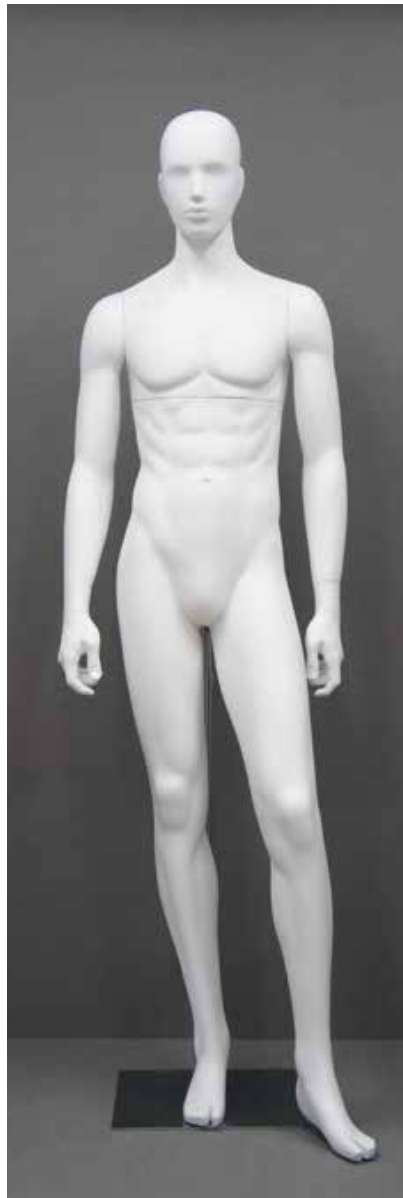
RD-103.BS.R-A T 185.0/B 91.0/W 73.0/H 91.0